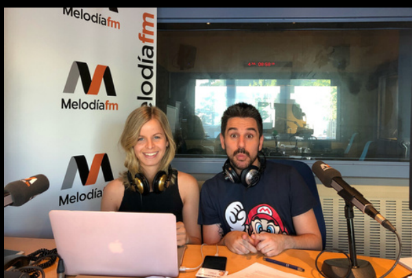
Colaboración en el programa "Despiértame Juanma" Melodia FM ( Grupo Atresmedia)