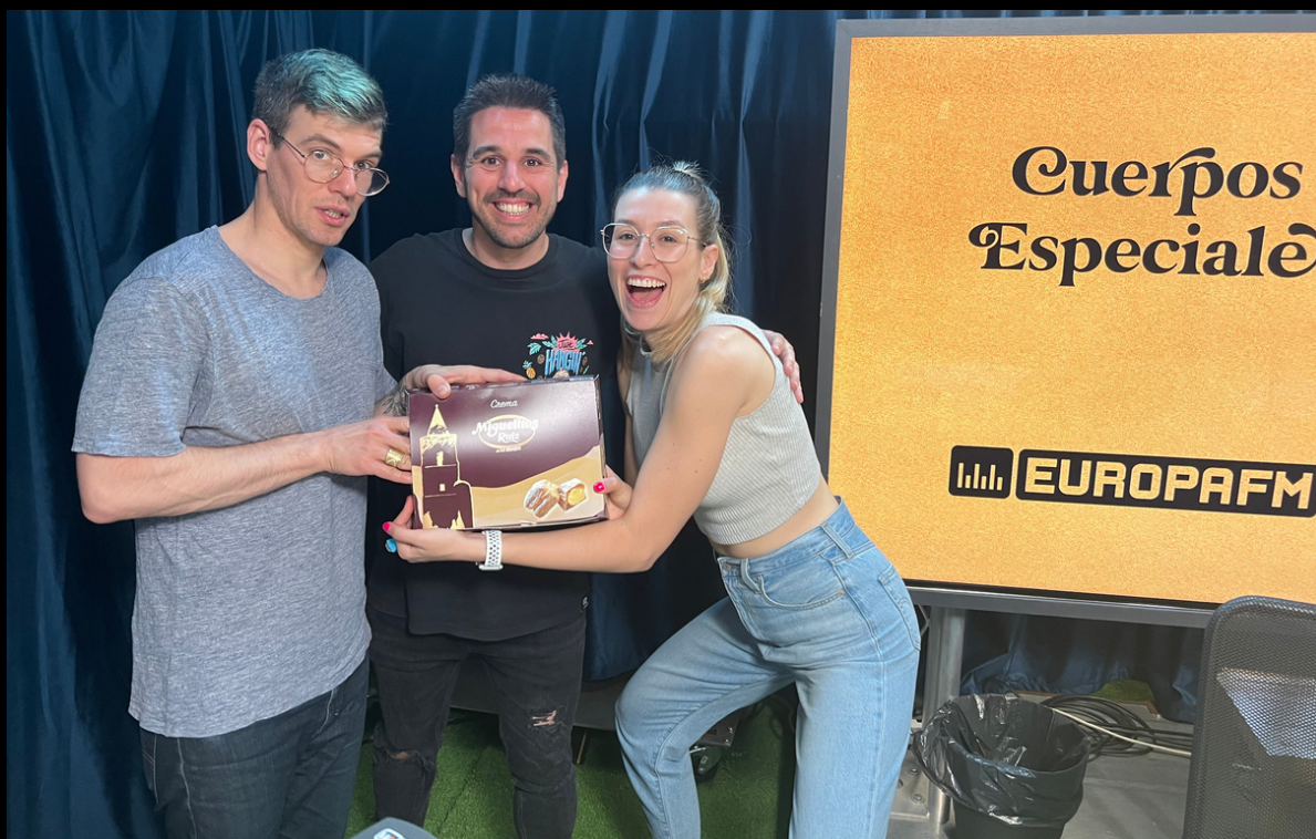
Colaboración en el programa de radio "Cuerpos Especiales" de Europa FM