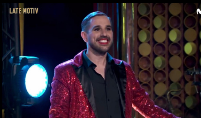
Colaboración en el programa "LATE MOTIV" Movistar+