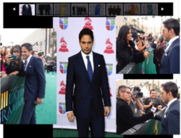
El bailarín de flamenco Curro de Candela posa a su llegada para la décimo tercera edición de los Grammy Latino hoy, jueves 15 de noviembre de 2012, en Las Vegas, Nevada (EE.UU.).