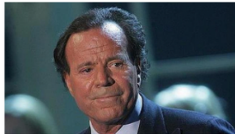
Julio Iglesias no estará este año en Starlite